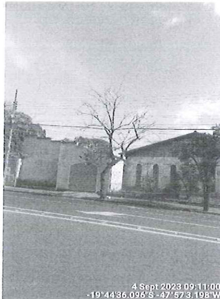
Figura 1 – Vista da pata-de-vaca morta.

Diante da situação, recomendamos o desmonte do espécime e encaminhamos a presente solicitação para a Secretaria de Serviços Urbanos e Obras para conhecimento e execução.